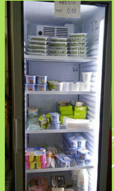
Latticini, piatti pronti (mensa), insaccati, ecc.