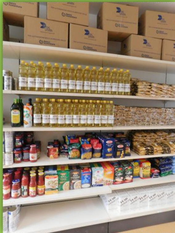
Prodotti «secchi»: Pasta, riso, olio, tonno, pelati, zucchero, farina ecc