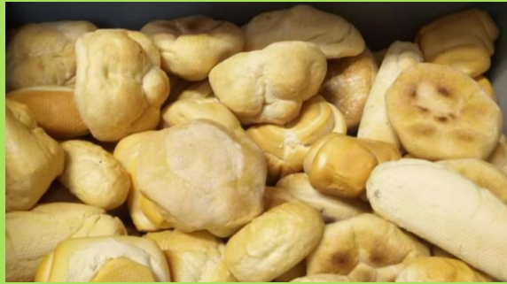
Pane e dolci